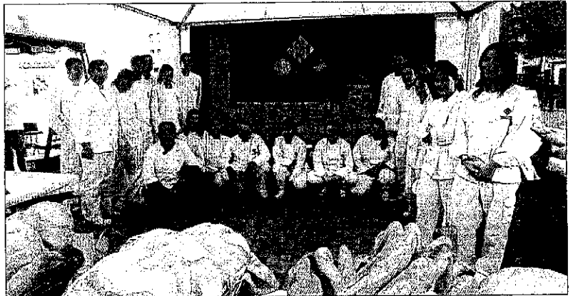
El Gremi de Forners es va reunir ahir a la plaça de Sant Joan per repartir pans de cervesa.

A més, els assistents també van poder observar una escultura de la Seu Vella feta amb 300 quilos de pa de cervesa, en l'elaboració del qual han col·laborat els 24 alumnes (el doble que el 2008) del cicle formatiu de fleca i rebosteria de l'Escola d'Hos- taeria.