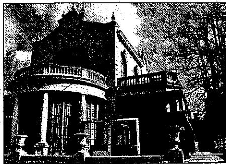
El establecimiento superaba el aforo autorizado por la ley

Los Mossos d'Esquadra, en cumplimiento de la resolución de la Dirección General del Juego y Espectáculos, efectuaron ayer por la mañana el cierre del local de ocio nocturno River Café situado en la capital del Segrià duran-