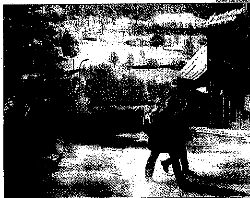
Salardú ja té un carrer en rampa calefactada per evitar-hi la formació de gel.

Naut Aran disposarà d'una instal·lació soterrada per facilitar aigua calenta a edificis públics i hotels cremant vegetació i restes de fustes dels seus boscos.