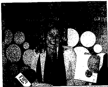
La presidenta de Turisme de Lleida presentó la fiesta