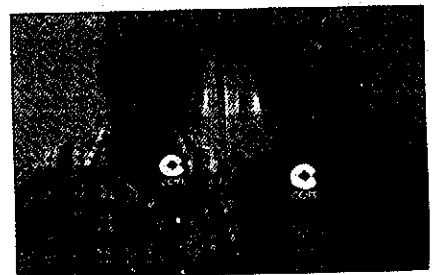
COPE Lleida, la ràdio més propera