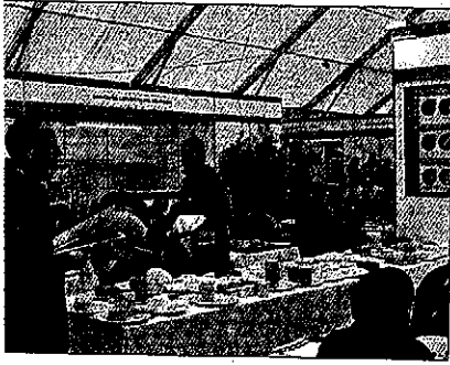
Concurso de quesos se celebró en la carpa