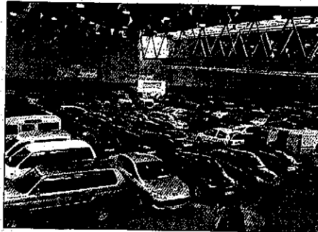
Firauto presenta un cien por cien de ocupación

El subdelegado del Gobierno pudo saludar personalmente a los diferentes expositores del certamen de esta edición, quienes le transmitieron las buenas sensaciones que les daba este año Firauto Balaguer en cuanto al número de transacciones económicas que podían realizar a lo largo de todo este fin de