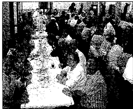
Muchos vecinos de Juneda se desplazaron a Barcelona

La jornada fue organizada por el Ayuntamiento de