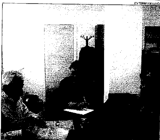
ICV TERRÉS DE LLEIDA

TREMP | Una cinquantena de treballadors de l'ajuntament de Tramp han rebut informació sobre el protocol per prevenir situacions de persecució a l'empresa. La iniciativa forma part de les accions desplegades pels consistoris en el marc del Pla d'Igualtat d'Oportunitats.