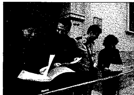
La CUP hizo un acto ante la sede del DPTOP en Lleida

Finalmente, critican también que los equipamientos des-