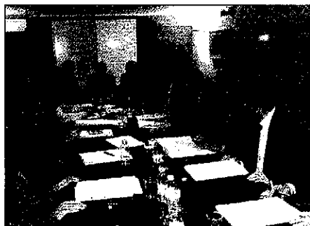
Los políticos de Lleida durante la reunión de ayer

d'Economia, Lleida es un "caso claro" donde se demuestra que el sector agroalimentario "ha soportado" mejor la crisis que otros. En este sentido, añadió que en la medida en que haya una cierta es-