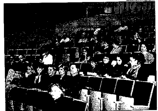
Les jornades que s'acaben avui, se celebren al campus de Capponet.