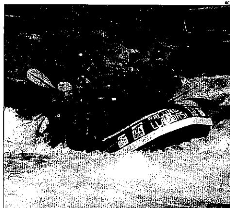
Una de les primeres barques que estrenen temporada de ràfting.