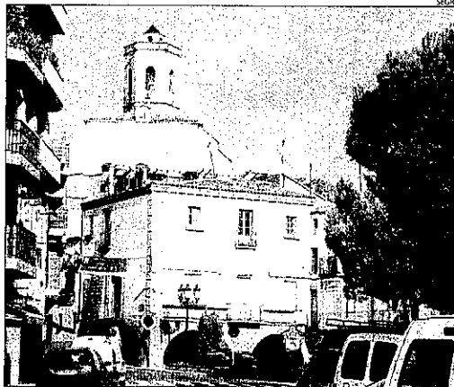
imatge d'arxiu del centre de la localitat.

També destaquen que l'eixamplament d'alguns carrers del nucli antic obligarà a enderrocar cases habitades i que els habitatges tindran diferent profunditat en funció dels àmbits d'actuació, cosa que, segons asseguren, implicarà que siguin menys competitives pel que fa