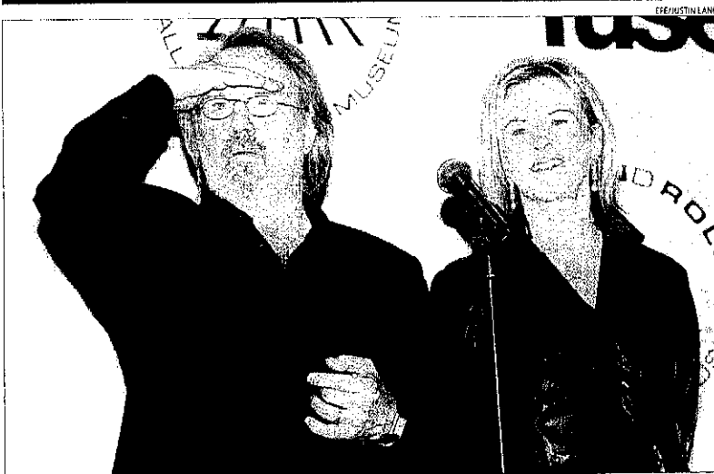
Benny Anderson i Anni-Frid Lyngstad, exmembres del grup i exparella, durant la cerimònia.