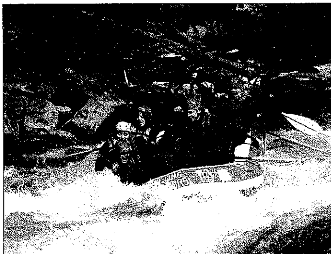
Dos barcas estrenaron la temporada bajando en rafting de Llavorsí a Rialp

El convenio que hay entre las empresas de deportes de aventura y las hidroeléctricas para garantizar un caudal suficiente de agua para la práctica de deportes de río está vigente desde este lunes hasta el 15 de octubre. Durante la temporada pasada se superaron las 330.000 actividades de deportes de aventura en el Pallars Sobirà, cifra que se quiere repetir este año. El Sobirà es un referente mundial en este sector.