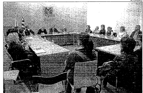
Preocupació del sector sanitari del Pirineu ■ Membres dels serveis sanitaris del Pirineu van expressar ahir la seua preocupació per les retallades al delegat de la Generalitat.

plements per a l'agricultura i la ramaderia; 25 són al saló de l'automòbil, ubicat al recinte de les piscines, i 128 estan dedicats a la maquinària agrícola, repartits entre les avingudes del Canal i la Pau, que ja s'han tancat al trànsit. El mateix dia se celebrarà la Nit dels Expositors, amb un sopar que reuneix 600 persones.