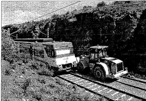
El tren descarrilat dimecres a la nit a Vacarisses.

El transbord al tram entre Manresa i Terrassa se suma al recorregut per carretera entre Calaf i Manresa, tram on Adif porta a terme millores a les vies. La caiguda de les roques so-