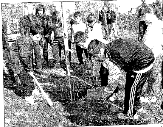
Diversos nens planten un arbre a la partida Copa d'Or i Sot de Fontanet.

Per la seua part, a Sucs, membres de l'associació recreativa cultural i col·laboradors de la localitat també van plantar arbres i van sembrar plantes aromàtiques al parc del Vilot.