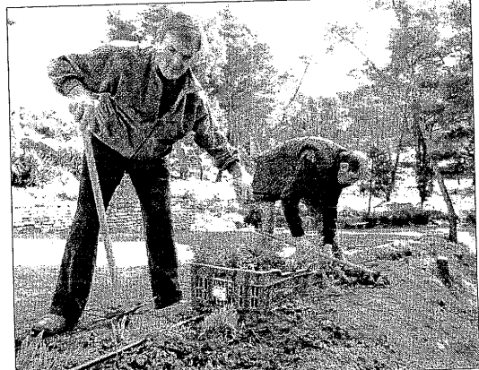
A Sucs, també es van sembrar plantes aromàtiques al Vilot.