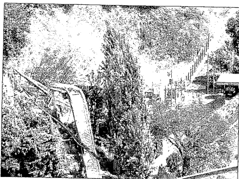
L'atracció El Pèndol, que es va desplomar al juliol del 2010.

[BARCELONA] La fiscalia demanarà la imputació per homicidi i lesions per imprudència dels professionals que van intervenir en el disseny, projecte, direcció, execució de l'obra i inspeccions de la instal·lació del Tibidabo El Pèndol, en què es va produir un accident en el qual va morir una jove de 15 anys i dos més van resultar ferides. L'informe pericial sobre la caiguda de l'atracció El Pèndol del Tibidabo conclou que la causa del sinistre va ser "la ruptura dels punts d'ancoratge del fust de l'atracció a la fonamentació de base". Aquesta ruptura va ser causada per "la fatiga mecànica, progressiva al llarg del temps, de l'acer amb el qual estaven fabricades les varetes roscades que constituïen els esmentats punts d'ancoratge". L'informe indica que "la qualitat resistent de l'acer amb el qual havien estat fabricades les varetes no era l'adequada per a l'ús al qual estaven destinades". "La incorrecta selecció