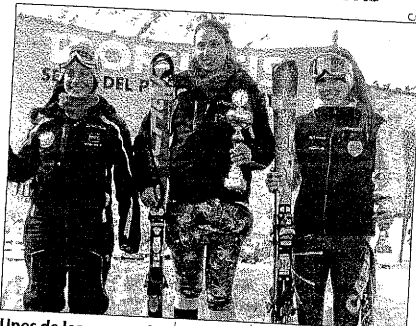
Unes de les guanyadores de la cursa de Port del Comte.