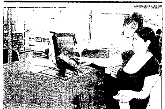
Carrefour instal·la caixes d'autoservei ■ Carrefour ha instal·lat al seu híper de Lleida caixes personals, en què el client pot pagar la compra pel seu compte només amb una targeta de crèdit.

En canvi, sí que segueix endavant la construcció de dos hotels del grup francès Accor entre Cappont i la Bordeta, prop del Decathlon. Són un hotel de la cadena Ibis, de setanta-sis habitacions i un altre de la cadena Etap, de vuitanta. Està previst que obrin el 2012.