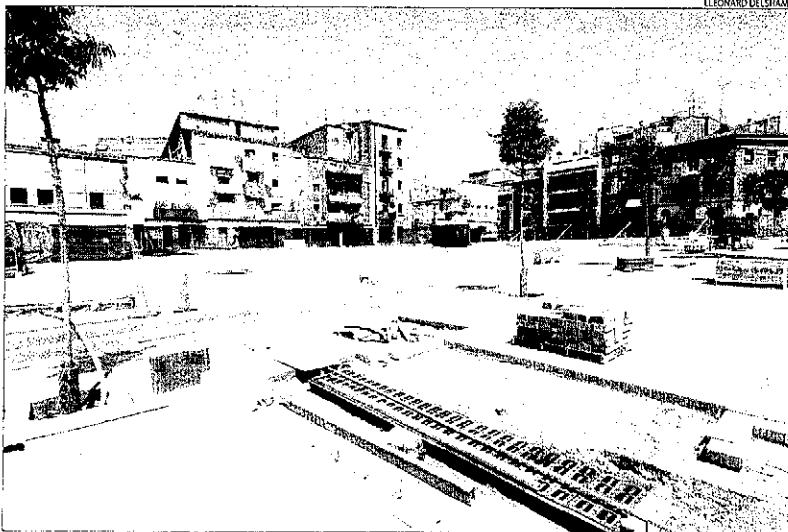
Gairebé acabada la nova plaça del Dipòsit ■ Les obres de remodelació de la plaça del Dipòsit, incloses dins del pla de barris, ja estan pràcticament acabades. La plaça, on s'està acabant de col·locar el nou paviment, guanyarà espai per als vianants, ja que s'ha eliminat la circumval·lació viària que hi havia a l'antiga.