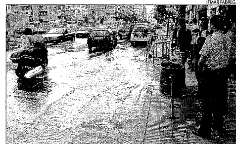
Un gran raig d'aigua va inundar part del carrer.