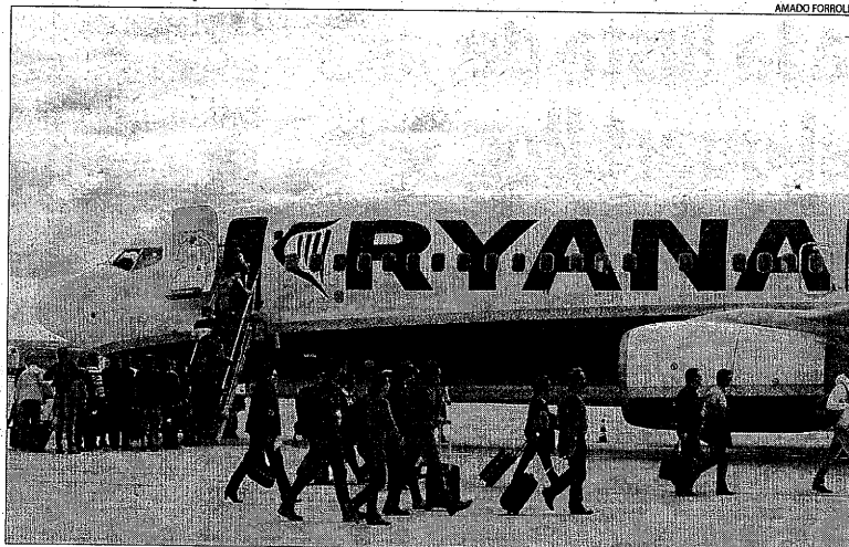
Viatgers dirigit-se a l'avió que els havia de traslladar fins a l'aeroport de Bergam.