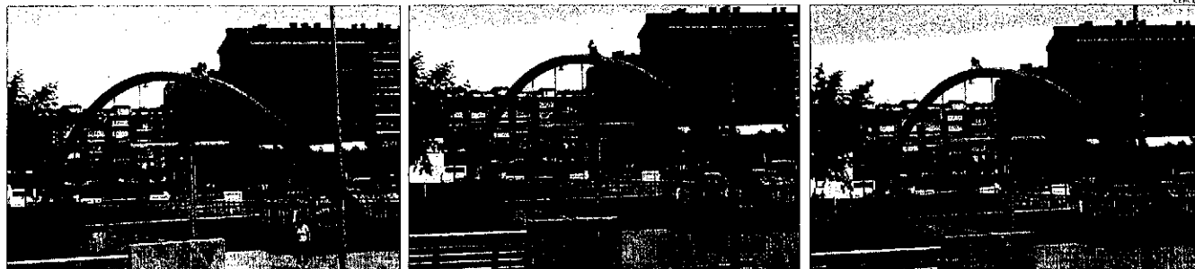
Seqüència d'imatges preses per un lector de SEGRE en què s'observa la noia al cim de l'arc i dos amigues a la passarel·la anant la nena divendres passat.

SEGURETAT L'AJUNTAMENT NO HA REBUT QUEIXES, MOTIU PEL QUAL NO HA PRES MESURES, I ARA PARLARÀ AMB ELS ENGINYERS