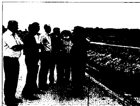
La Junta de GAS visitó el futuro punto de captación

jetivo de acelerar a la vez los trabajos que han de interconectar las redes de la Vall del Sió y del Mig Segre. Esto permitiría que los núcleos que todavía dependen exclusivamente de sus propios recursos para el abastecimiento de agua de boca, puedan recibir una dotación de apoyo desde la nueva potabilizadora de Ratera. Se trata, en concreto, de los núcleos de Selvanera,