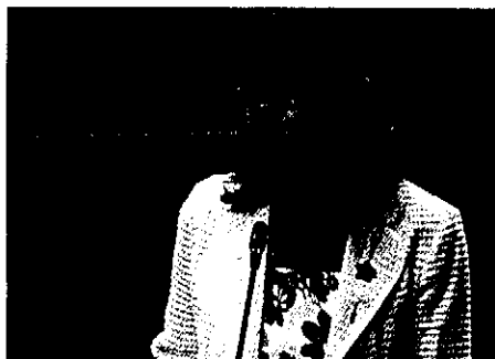
Espinosa responde a la pregunta de Llorens

Espinosa respondió en el pleno del Congreso a una pregunta del diputado del PP por Lleida Jose Ignacio Llorens sobre las gestiones del Ejecutivo ante el anuncio de que la Generalitat, para cumplir con las sentencias del Tribunal de Justicia Europeo, ha aprobado aumentar en 14.287 hectáreas la zona destinada a ZEPAS en la superficie regable del Canal Se-