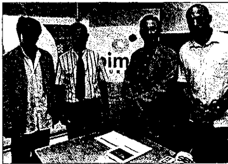
El estudio se presentó en la sede de PIMEC en Lleida

Durante la presentación ayer en Lleida de un estudio sobre la repercusión económica de la normativa sobre la competitividad en el sector hotelero, los representantes de PIMEC anunciaron que alegarán contra los proyectos de ley de prevención y control ambiental; de la Agencia Catalana de Turisme; de prevención y seguridad en materia de incendios; de protec-