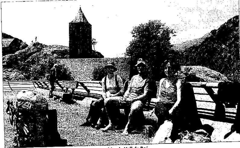
Turistes francesos de Lió i Bordeus van estar ahir a la Vall de Boi.