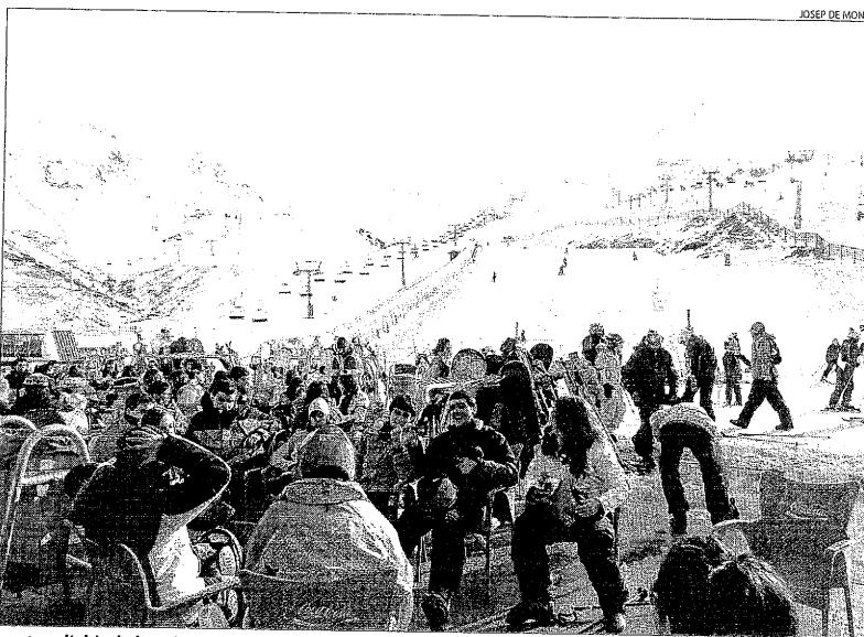
Imatge d'ahir de les pistes de Boi-Taüll, que van registrar una bona afluència d'esquiadors.