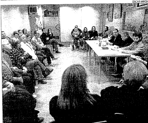
L'assemblea de Jaume I va reunir ahir uns quaranta veïns.