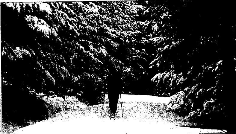
La modalitat de fons, l'esquí nòrdic, és la que ha donat més olímpics a Lleida.