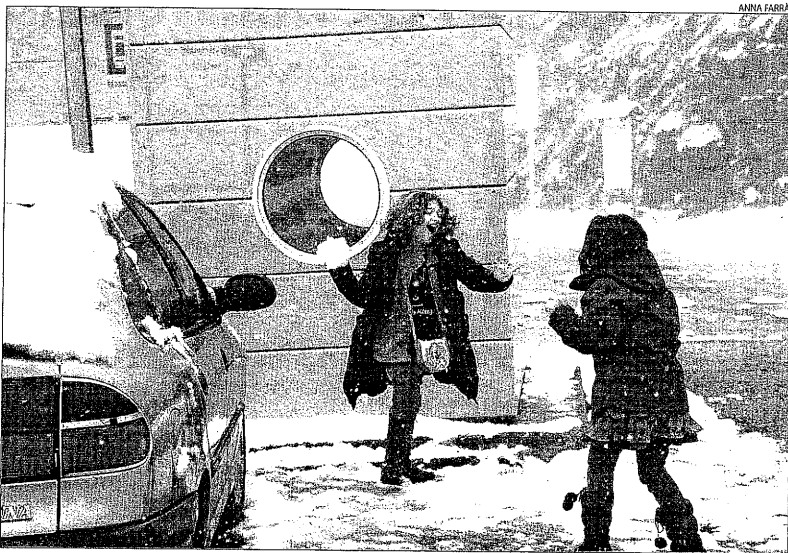
Dos nens de viatge pel Pirineu juguen amb la neu al nucli de Benavent, al port de Comiols.

L'estació de Boí-Taüll xifra en un 75 per cent l'ocupació en aquestes dos setmanes. Per la seua part, a Gran Pallars (Port Ainé i Espot Esquí) la setmana que ve arribaran els primers grups d'escolars procedents de la Gran Bretanya.