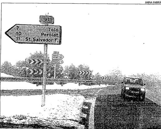
La neu a l'encreuament del port de Comiols.

D'altra banda, al pla també es preveuen cels clars amb temperatures mínimes que no baixaran dels zero graus.