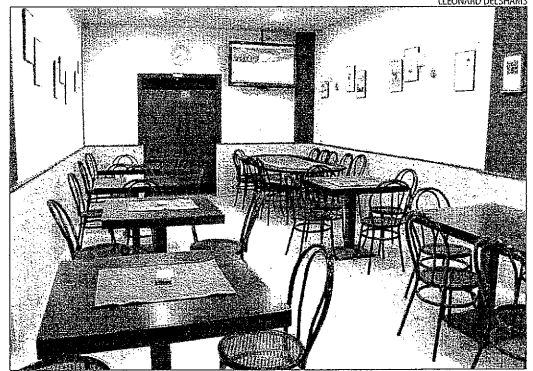
Imatge de la sala del nou club de fumadors de Ronda.

D'altra banda, la Federació Estatal d'Associacions d'Empreses de Teatre i Dansa (que agrupa gairebé 400 empreses i companyies productores) va demanar ahir a l'Administració "que pel bé del teatre i el respecte a la llibertat artística", la llei antitabac "no afecti les representacions teatrals ni els rodatges cinematogràfics".