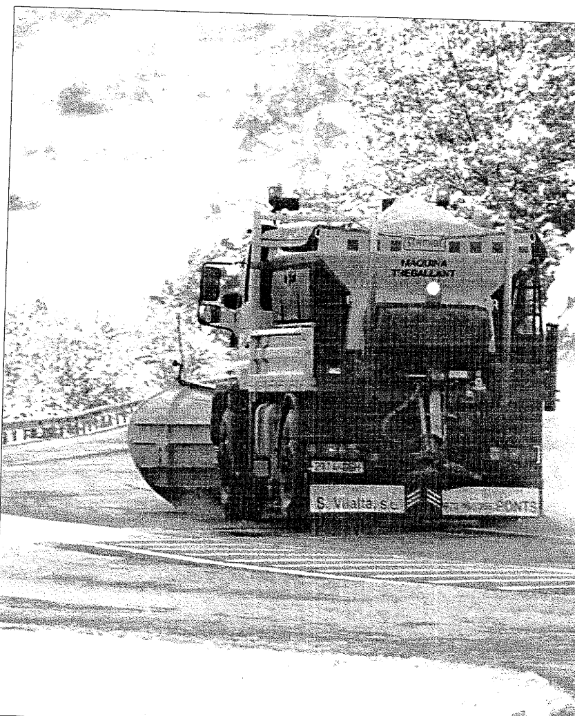
Una máquina quitanieves limpia la carretera a la altura del pueblo de Biscarri

La previsión es que hoy viernes dominará el sol en la mayoría de comarcas catalanas y las temperaturas se recuperarán.