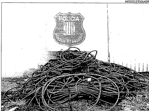
Coure que volien robar a Torregrossa decomissat pels Mossos.

explica que els lladres tot just tenen temps de robar. "Els sento i baixo de seguida, l'última vegada vaig veure com fugien corrent." Ara ha ampliat el sistema de videovigilància del negoci com a mesura dissuasiva.