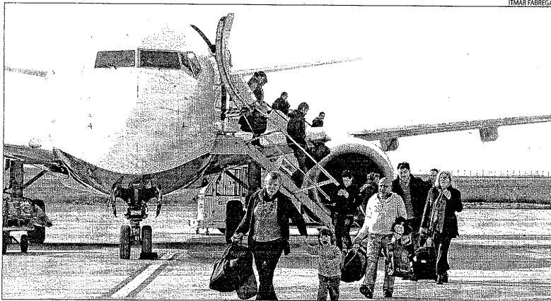
Els avions de Ryanair van operar ahir a l'aeroport de Lleida-Alguaire amb tota normaltat.

■ Els trens Alvia hi podran circular gràcies al model de via intercanviable que ara s'utilitza.