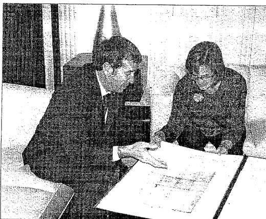
Boya va entregar una reproducció d'Era Querimònia a De Gispert.

Durant la trobada, Boya va rebre el compromís de la presidenta de mantindre l'oficina d'Aran al Parlament, creada durant la passada legislatura.