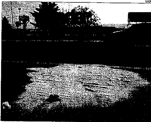
L'atropellament mortal es va produir just davant de la discoteca Wonder.

Entre altres mesures, han ubicat la parada de taxis i autobusos just davant de la discoteca, han tancat el perímetre del complex i també han ampliat la zona d'aparcament. Es dona circumstància que està en estudi la construcció d'una rotonda a