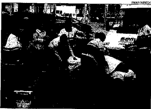
Els tècnics sanitaris atenen el motorista accidentat.