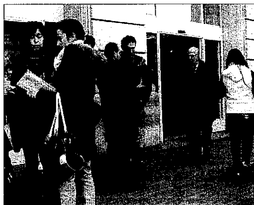
ERC repartirà 2.000 tríptics entre els usuaris dels trens.

Vidal va afirmar que tant a través del grup parlamentari republicà al Congrés com a través del Senat faran preguntes al ministre de Foment José Blanco "per acabar amb aquest greuge i millorar les condicions d'accessibilitat a aquests trens".