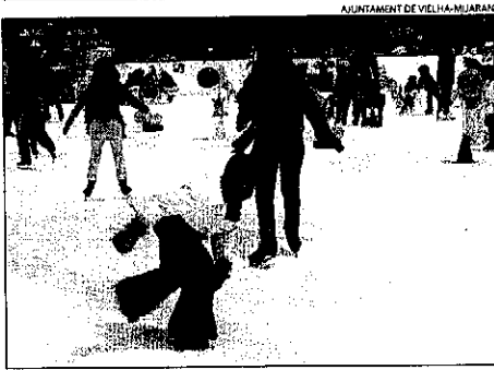
AJUNTAMENT DE VIELHA-NUJARAK