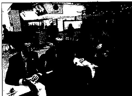
Una comisión del aeropuerto visitó la feria BIT de Milán