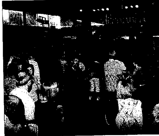
Imatge d'ardu de les últimes festes majors de Corbins.

Sobre la falta d'informació i transparència que denuncien els diferents alcaldes, Sitjes va assenyalar que la llei de propietat intel·lectual estableix que els ens que facin comunicació pública han de demanar una llicència i pagar les tarifes corresponents, "que van a parar als autors, de forma proporcional a l'ús que es faci de la seua obra", va explicar.