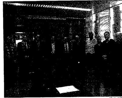
La Mancomunitat de Pinyana se reunió ayer en Lleida

El disco será vendido a un precio de 5 euros y entregado conjuntamente con el número de Navidad de dicha publicación.