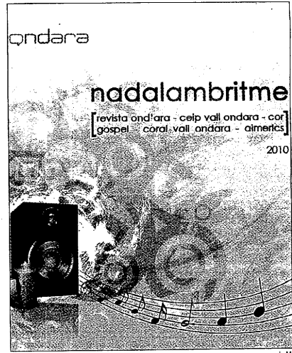
Portada del disco iniciativa de la revista municipal

medioambientalmente sostenible, lo que se refiere al consumo de su red y de sus equipamientos públicos. Cuando haya terminado de desarrollar el conjunto de instalaciones previstas, Les Borges aborra-