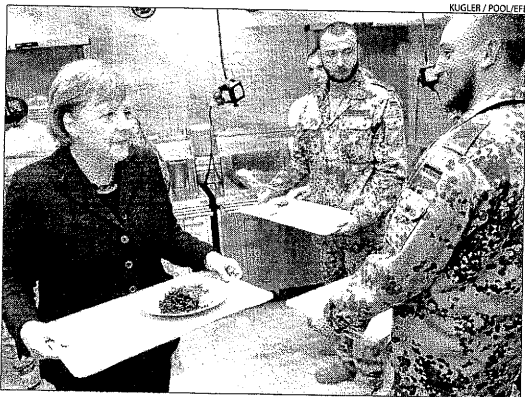
Merkel conversa amb soldats germànics a la base de Kunduz.