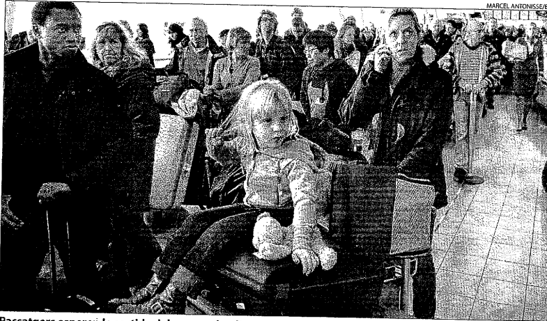
Passatgers esperen la sortida dels seus vols a l'aeroport internacional de Schipol, Holanda.

Els principals aeroports de Bèlgica i Holanda van registrar cancel·lacions i importants retards. Alemanya va anar recuperant lentament la normalitat i els principals aeroports del país estaven en funcionament, encara