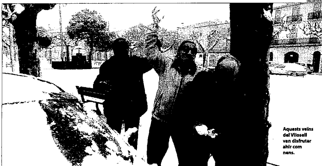
Aquests veïns del Villosell van disfrutar ahir com nens.

Brusc descens de les temperatures, que al Pirineu arriben a -13 graus