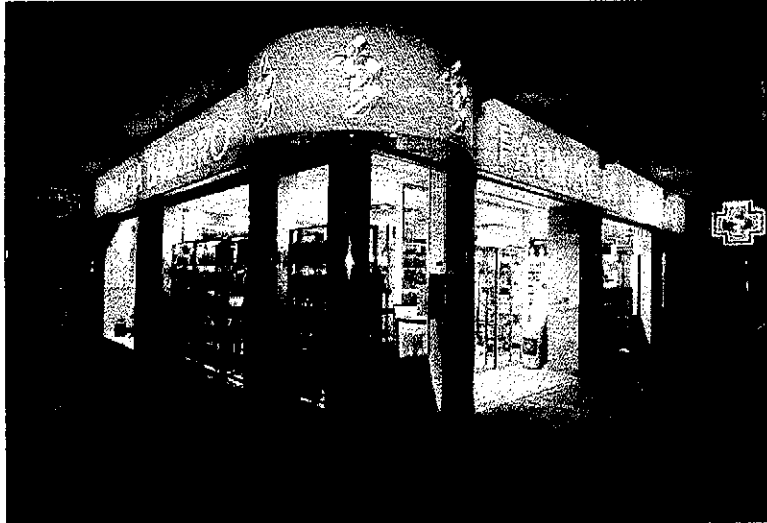
La primera farmàcia de Lleida que obrirà 13 hores al dia està ubicada entre Riu Ebre i Doctora Castells.

tir de l'1 de gener funcionarà de 09.00 a 22.00 hores tots els dies de l'any. Aquest primer canvi podria fer que altres farmàcies també amplii horaris.