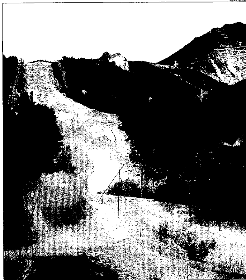
Canons de neu funcionant ahir a l'estació d'Espot Esquí.

D'altra banda, el temporal de neu al pla va amainar ahir, si bé van ser necessàries cadenes en tres carreteres. La circulació a la carretera C-242 seguia al màxim restringida per a vehicles pesants entre Maials i les Borges del Camp, mentre la resta de vehicles havien d'usar cadenes. També van ser necessàries en aquesta mateixa carretera entre Seròs i Maials i per la L-701 a Juncosa. Així mateix, persistia el gel a la N-240 entre les Borges i Tarrés i a la via entre Calaf i Sant Guim. Un total de 132 nens no van anar a classe a les Garrigues per la interrupció del transport escolar.