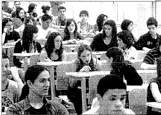
Alumnes abans de començar les proves de selectivitat aquest any.

L'anunci d'Educació arriba després que el Govern suprimís les quotes que limitaven l'accés de titulats de FP a les carreres, fet que suposa que els estudiants