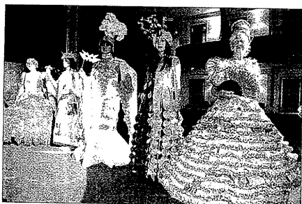
Última edición del concurso de Vestits de Paper

La exposición tenía que cerrar puertas el pasado domingo pero ante el gran éxito de público que ha tenido (más de 200 personas diarias) la organización se ha visto obligada a alargar el periodo de apertura hasta el día 22 de agosto. Se trata de una muestra más de la buena acogida que tiene fuera de Catalunya el concurso de Vestits de Paper.