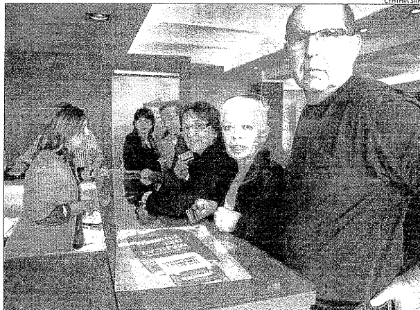
Turistes en un hotel de la Seu, participants a la trobada de gegants.