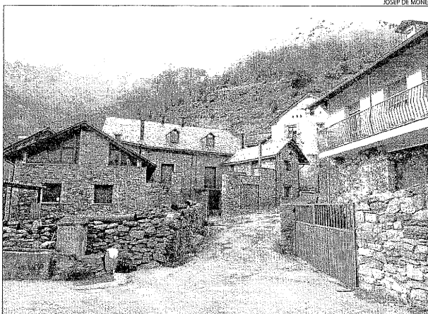
Cardet, un poble amb una família resident i tres cases de turisme rural.