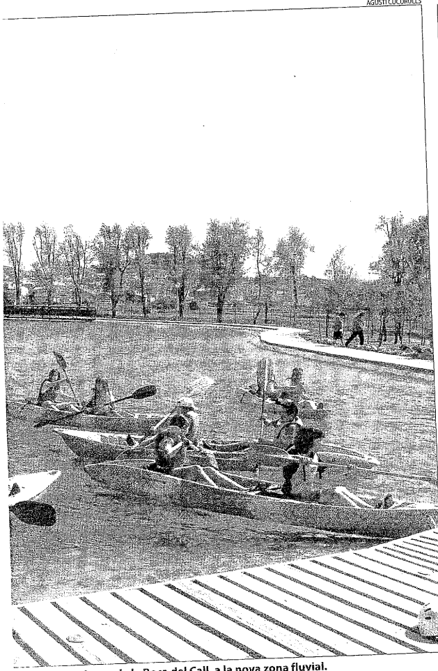
Se dividiren al parc de la Roca del Call, a la nova zona fluvial.

Segons l'INE, al febrer, Lleida ofería 18.150 places d'hoteleria, 3.569 places de turisme rural i 3.429 parcel·les per a càmpings. Per a aquesta Setmana Santa, es preveu una ocupació mitjana del 70 al 85 per cent.