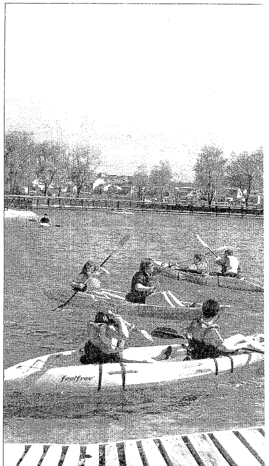
Estudiants del CEIP de Ponts, durant una de les activitats portades a