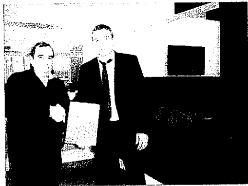
L'Aplec del Caragol es suma al programa de responsabilitat social de Renfe "Un tren de valors".

Renfe, transportista oficial del Caragol Tour