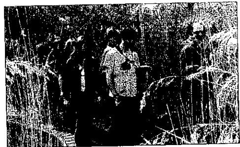
Els nens van ser els principals protagonistes ahir.