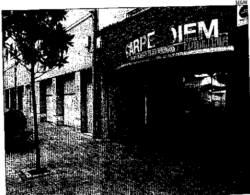
Imatge d'arxiu de la discoteca d'Almacelles.

L'anul·lació suposa que el local podrà acollir-se als horaris que fixa la normativa de la Generalitat, i que n'autoritzen