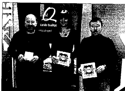
La directora del Patronat y dos de los organizadores

El día 30 de mayo está prevista la clausura del Ral·li con la celebración de una cena y la entrega de las Xicoles d'Or a los diferentes galardonados