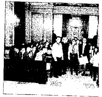
Ofrecieron un concierto con la orquesta