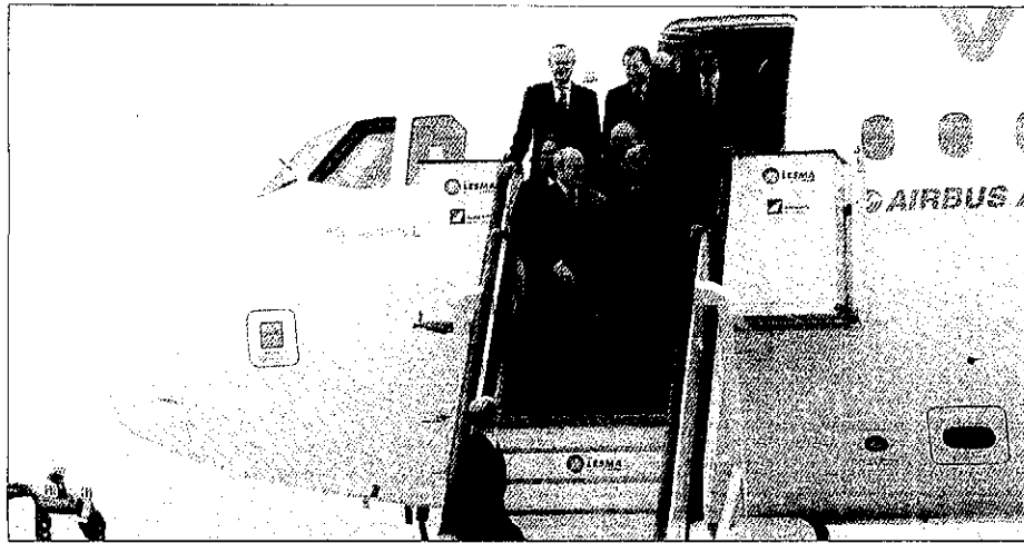
Montilla, Carod-Rovira y Benach llegaron juntos al Aeropuerto de Lleida-Alguaire